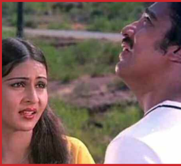
એક દુજે કે લિચે