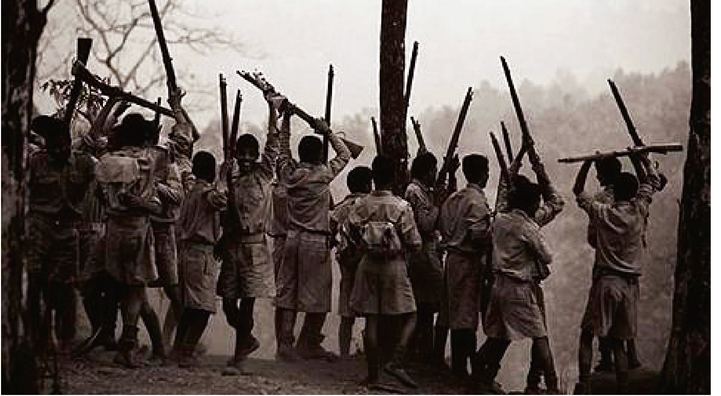
૧૯૩૦ની ચિત્તાગોંગના શસ્ત્રાગારની લૂંટની એ શકવર્તી ઘટના દર્શાવતી એક પ્રતીકાત્મક તસવીર

બંગાળના એક નાનકડા ગામ ચિત્તાગોંગમાં એક યુવાન એવો હતો જેને ધોળા ભેડિયાઓ સામે માથું ઝુકાવીને ડંડા ખાવાનું પસંદ નહોતું. એના લોહીમાં જ નહોતું. એનું નામ સૂર્યસેન. ઉંચાઈ શારીરિક અને બૌદ્ધિક રીતે સારી એવી. શરીર એકવડિયું પણ ઈરાદાઓ મજબૂત. વર્ષો શ્યામ પણ ચહેરા પર દેશ માટે કંઈ કરવાની ઈચ્છાનો અંગારો.